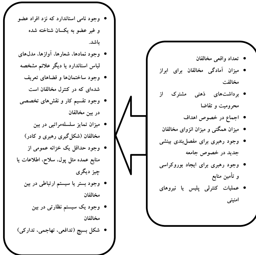
نمودار ۲. مدل مفهومی سازماندهی در ناآرامی خیابانی

در نمودار مذکور، جهت فلش نشان‌دهنده جهت تأثیر عوامل مؤثر بر سازماندهی بر شاخص‌های سازماندهی است. یعنی عواملی که در سمت راست نمودار ذکر شده‌اند بر شاخص‌هایی که در سمت چپ نمودار قرار دارند، تأثیرگذار هستند. با بررسی عوامل سمت راست می‌تواند دلایل افزایش یا کاهش میزان سازماندهی در ناآرامی خیابانی را تحلیل کرد. برای ارائه برآوردی از میزان سازماندهی یک حرکت جمعی هم باید وضعیت شاخص‌های سمت چپ را مشخص کرد.