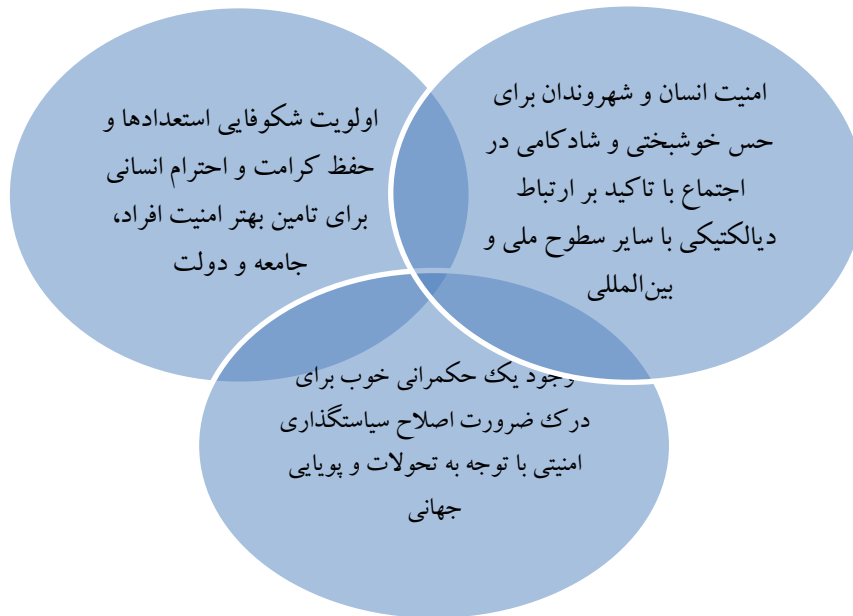
شکل ۴. پیوندهای مفهومی برای سیاست‌گذاری امنیتی مبتنی بر شادکامی مردم