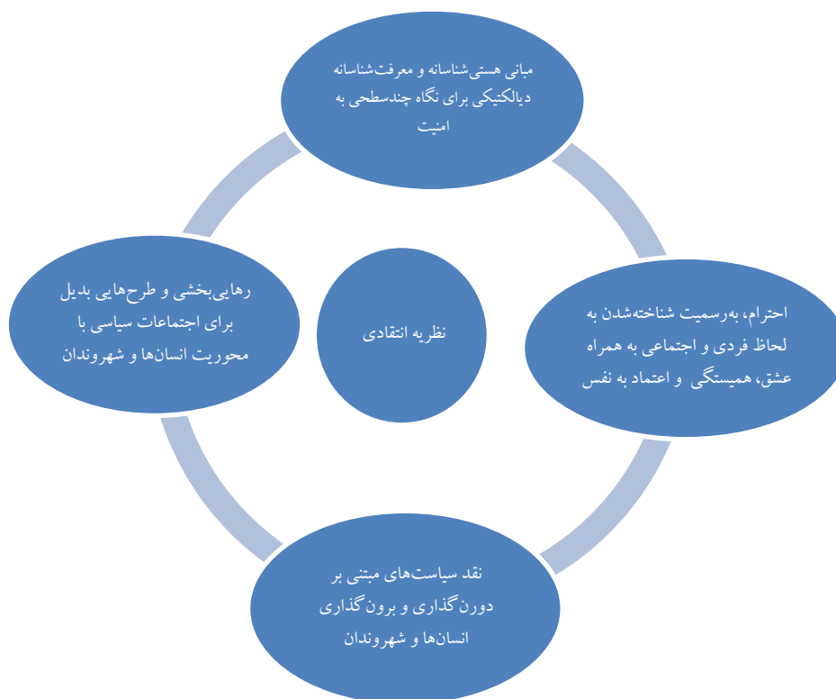
شکل ۱. مبانی مفهومی نظریه انتقادی برای چارچوب مفهومی

حال اگر برداشت فوق از نظریه انتقادی امنیت را در کنار محور مشترک تعاریف مفهومی و اهداف مرتبط با امنیت انسانی قرار دهیم که در آن بر «پاسداری از هسته حیاتی جان و زندگی همه انسان‌ها در برابر تهدیدات مهم و شایع به ترتیبی که با کرامت و شکوفایی بلندمدت انسان سازگار باشد» تأکید دارد می‌توان به چشم‌انداز نظری مدنظر این پژوهش تا حدی نزدیک شد زیرا طبق صورت‌بندی امنیت انسانی که بر برداشتی حقوقی (طبیعی/ قانونی) و بشردوستانه با دامنه‌ای گسترده از تهدیدات شامل صدمات اقتصادی، زیست‌محیطی، اجتماعی و دیگر انواع