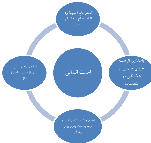
شکل ۲. مبانی مفهومی امنیت انسانی برای چارچوب مفهومی

می‌تواند به ما در تشریح دقیق‌تر شرایط لازم برای مدل نظری جهت اصلاح مسیر سیاست‌گذاری کمک کند. به عبارت دیگر، توجه به شاخص‌ها و اهداف طرح شادکامی در کنار مؤلفه‌های امنیت انسانی می‌تواند به سیاستگذار امنیتی مسیری را ارائه دهد تا در فرایند سیاست‌گذاری از تمرکز صرف بر بقا به سوی تمرکز بر حس شادکامی، ایجاد بستر برای شکوفایی تمام استعدادهای نیک و در نهایت کرامت انسانی حرکت کند.