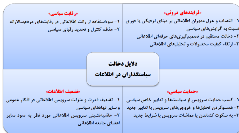
شکل ۳: مهمترین دلایل دخالت سیاست‌گذاران در فرایندهای درونی اطلاعات