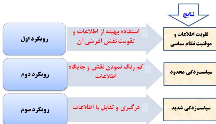
شکل ۲: گونه‌شناسی رفتاری سیاست‌گذاران در مواجهه با اطلاعات و نتایج آن