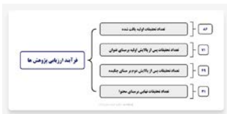
شکل ۲. فرآیند ارزیابی تحقیقات

در این مرحله از بین مقالات و پژوهش‌های در چند مرحله پالایش براساس عنوان پژوهش‌ها، بررسی چکیده و همچنین محتوای تحقیقات، تعداد ۳۷ مقاله به عنوان مقالات نهایی برای بهره‌برداری انتخاب شد.