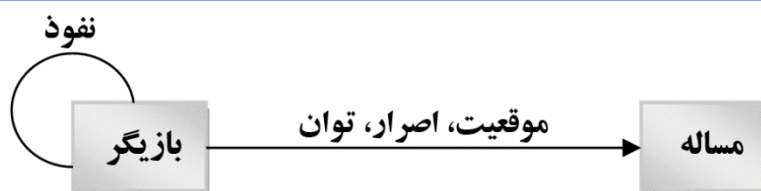
شکل ۱: اجزای تحلیل رفتار بازیگران در MACTOR

ماتریس‌های نفوذ (MDI) ۱ و اصرار (2MAO) ۲ در واقع دو ورودی نرم‌افزار MACTOR هستند و نرم‌افزار مبتنی بر این دو، کلیدی‌ترین بازیگران و موقعیت، توان، واگرایی و همگرایی بازیگران را ارزیابی می‌کند.